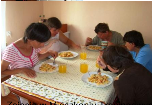
Zajęcia w Mieszkanii Terapeutycznej