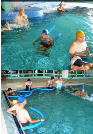
Zajęcia na Krytej Pływalni w Horyńcu